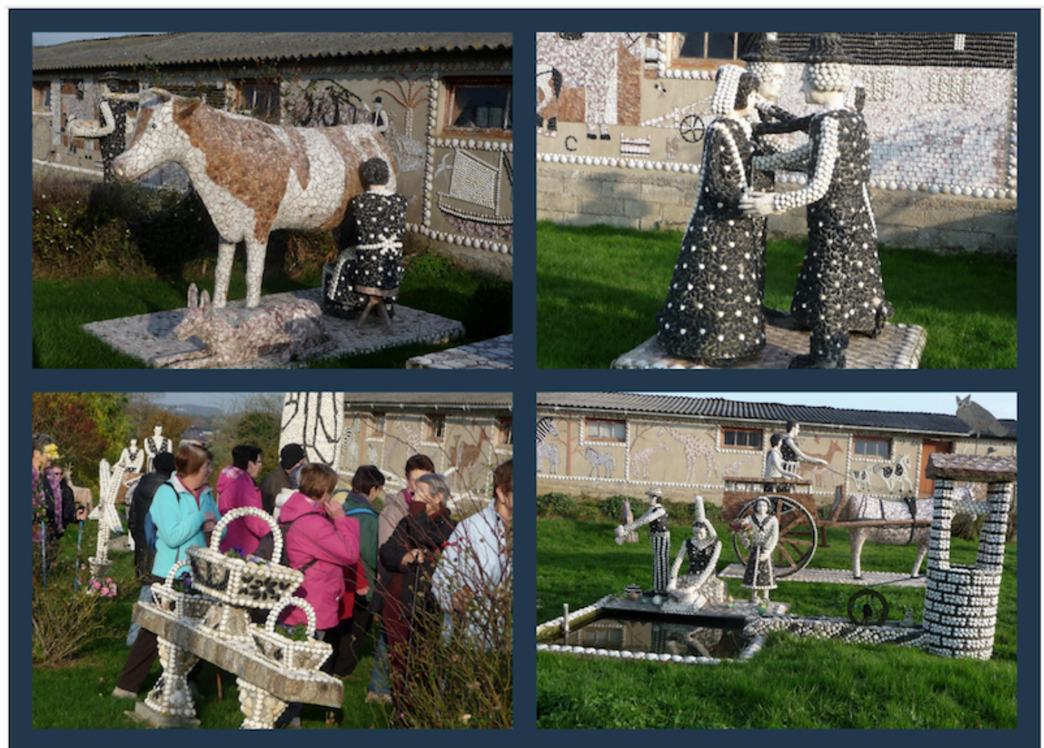
20. Des découvertes au détour d'un chemin.