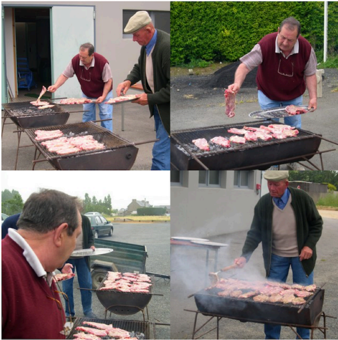
15. De même les cuistots.