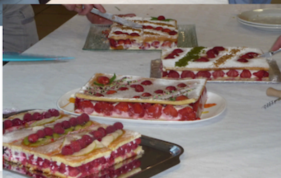
16 et tous les bénévoles qui mettent la main à la pâte dans une bonne ambiance.