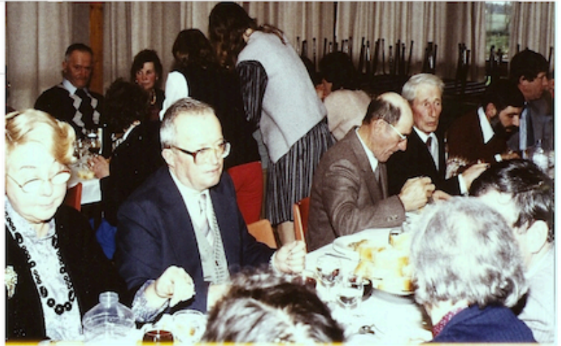
5. Repas annuel offert par le CCAS