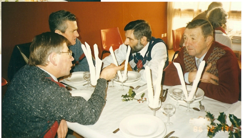
6. Des têtes plus jeunes, des conseillers municipaux participent à ce déjeuner.

Ce repas annuel offert par le CCAS s'arrêtera en 2000 et sera remplacé par une subvention plus conséquente.