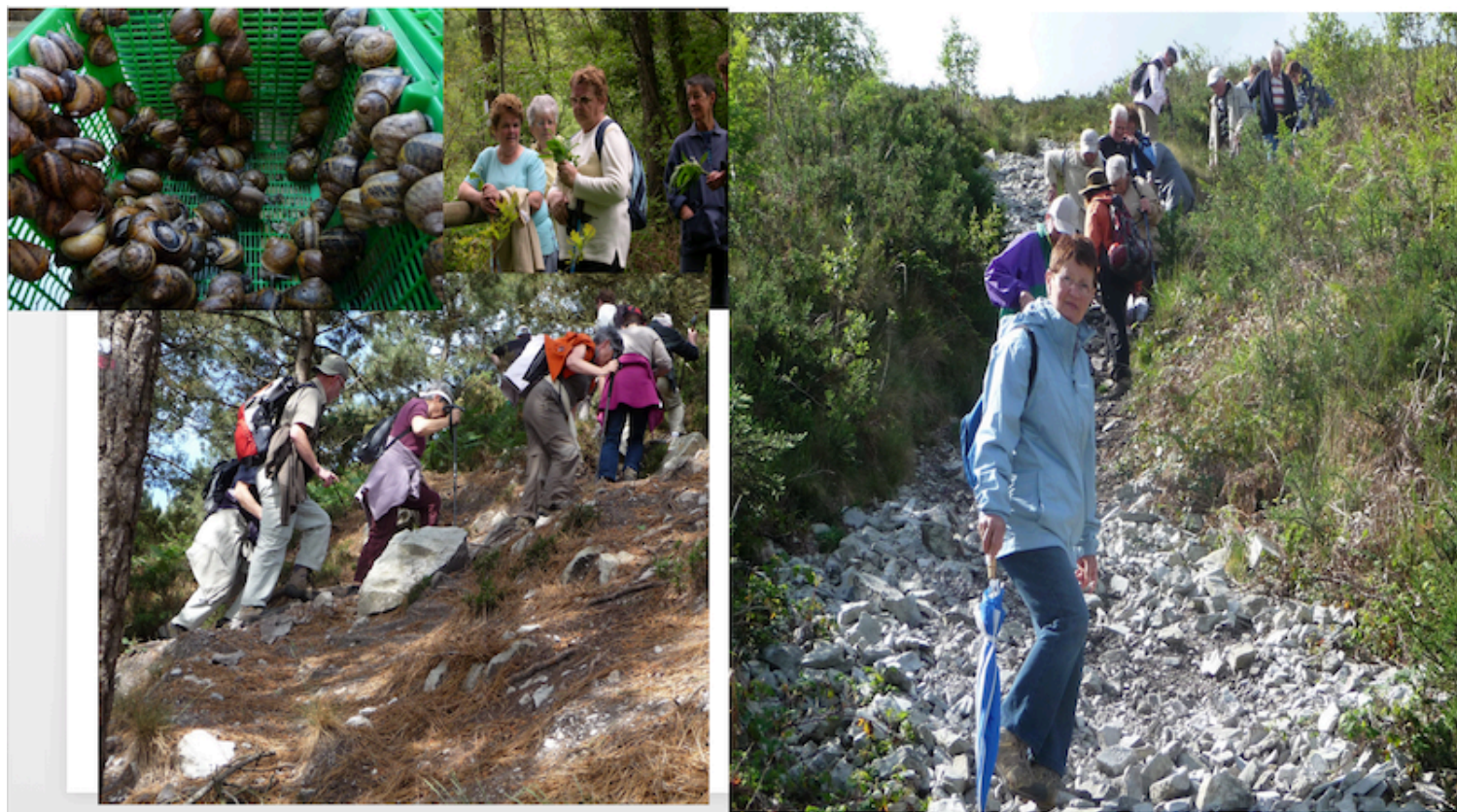
19. Parfois physique, mais bon pour la santé.