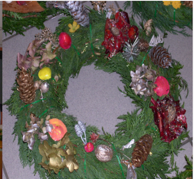
Atelier de Loisirs créatifs

23. Solidarité : confection de couronnes une année, puis de bougeoirs... ce qui permettait de faire un don de 300 à 400 € à l'occasion du Téléthon.